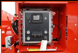
SISTEMA DE CONTROL

Avanzado sistema de diagnóstico monitorizado, presiones hidráulicas, temperaturas, sistemas de embrague y eficiencia de motor, con ajuste automático para un máximo rendimiento.